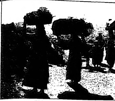
مخيم جليليا (قطاع غزة) من صخر أبو العون.